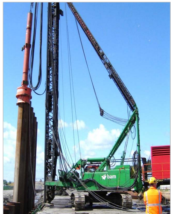
Naheien combiwand, A4-Oost