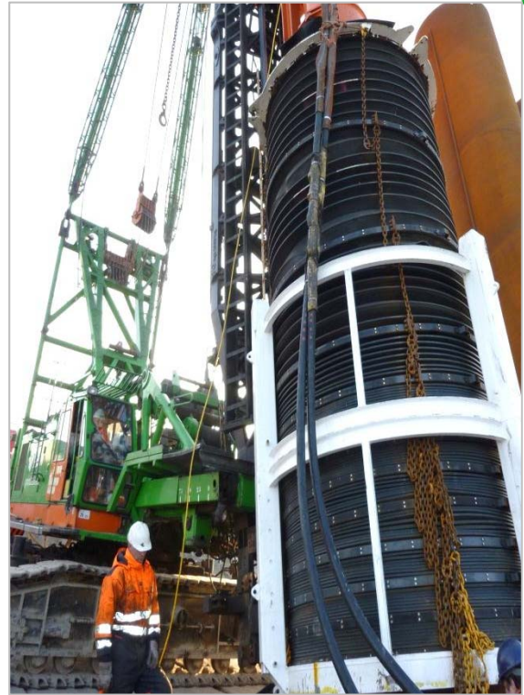
Heien combiwand met behulp van een geluidsbalg, Eemshaven

Buispalen kunnen worden aangebracht tot een diameter van 3,40 meter in verschillende schoorstanden. Afhankelijk van het ontwerp kan de schoorstand tot 5:1 bedragen. BAM Speciale Technieken kan een combiwand op het land én vanaf het water aanbrengen. Bovendien kunnen damwandprofielen van verschillende types en lengtes zowel vrij als makelaargeleid worden geplaatst. Het aanbrengen gebeurt door intrillen of heien. Indien de grondslag dit vereist, worden de profielen op de vereiste diepte gebracht door middel van spuiten, fluïderen, voorbereiden of voorwoelen.