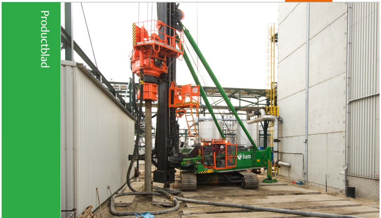
Uitbreiding Dr. Kolb, Moerdijk

De BAM VS-paal is een grondverdringende schroefpaal, die trillingsvrij en geluidsarm wordt aangebracht met behulp van een stalen boorbuis met een verloren boorpunt. Het aanbrengen gebeurt indien nodig onder toevoeging van groutinjectie (BAM VSi paal).