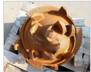
Getande BAM VS-punt