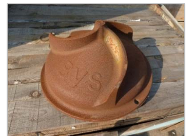
Gewone BAM VS-punt