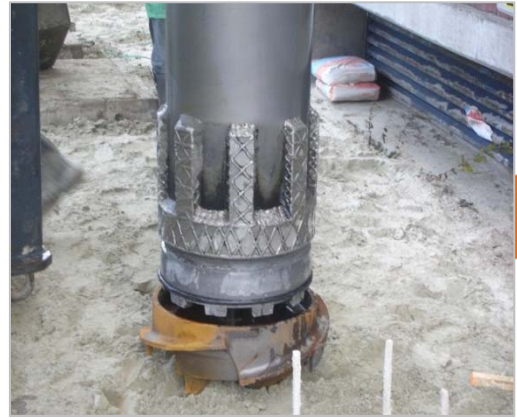
Insteken boorbuis (in boorpunt)