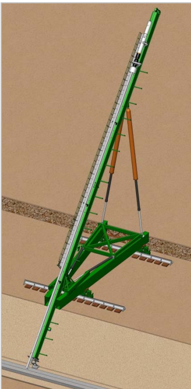
Kademuren Wilhelminahaven, Eemshaven

Tijdens het inheien wordt de holle ruimte achter de punt of de stalen bakjes direct gevuld met cementgrout. Op deze wijze wordt een grout-omhulling rond het stalen profiel gerealiseerd. Dit grout zorgt voor smering tijdens het heien en zorgt na verharding voor de verankering van het profiel in de ondergrond. Tijdens het inheien worden de inbrengsnelheid en de grouttoevoer geregistreerd om de kwaliteit van het proces zorgvuldig te bewaken.