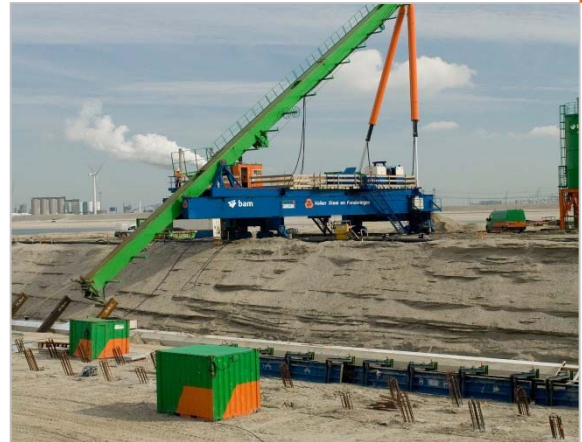
Kademuren Maasvlakte 2

Grondmechanisch ontwerp conform NEN 9997-1, CUR 2001-4 trekpalen en CUR 166