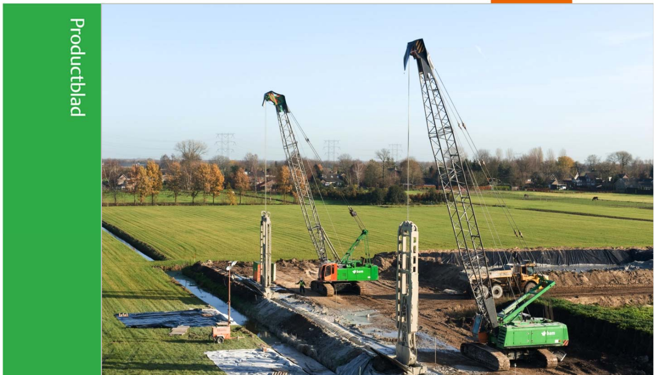
Graven cement-bentonietwand, 's-Gravenmoer

Cement-bentonietwanden zijn in de grond gevormde wanden en hebben een waterkerende functie. De steunvloeistof wordt voorzien van cement die na verloop van tijd uithardt, waardoor een wand met een geringe waterdoorlatendheid ontstaat. Dergelijke wanden zijn uitermate geschikt voor zogenoemde polderconstructies.