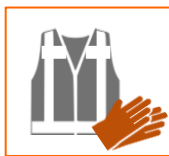
Gebruik de verplichte pbm