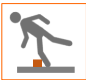
Looppaden vrij van struikelgevaar