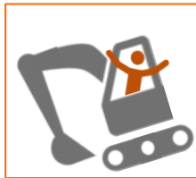
Werken met (groot) materieel