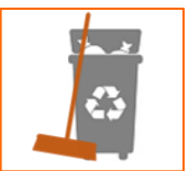
Geen afval op en rond bouwplaats