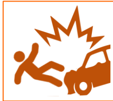
Aanrijden/ Aangereden worden